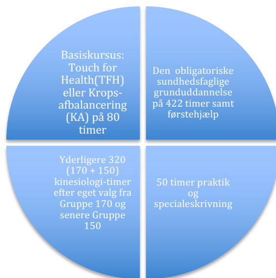
DIAGRAM - UDDANNELSE TIL DK-KINESIOLOG®