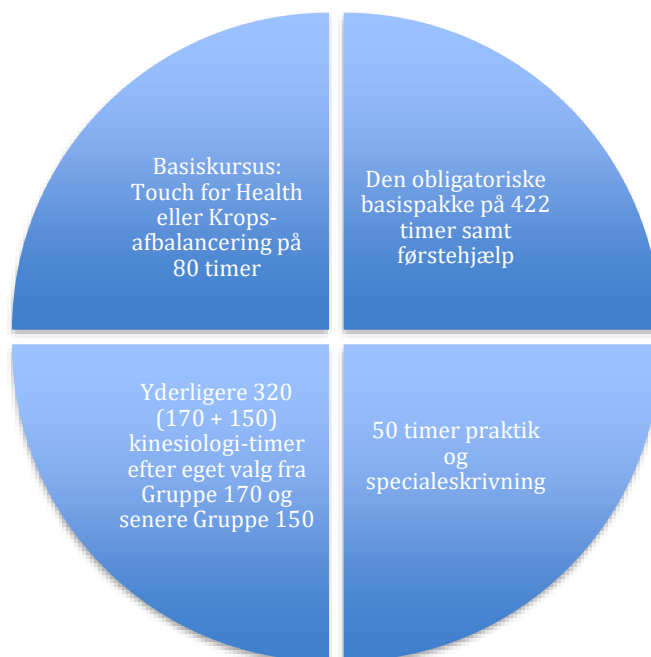
DIAGRAM - UDDANNELSE TIL DK-KINESIOLOG